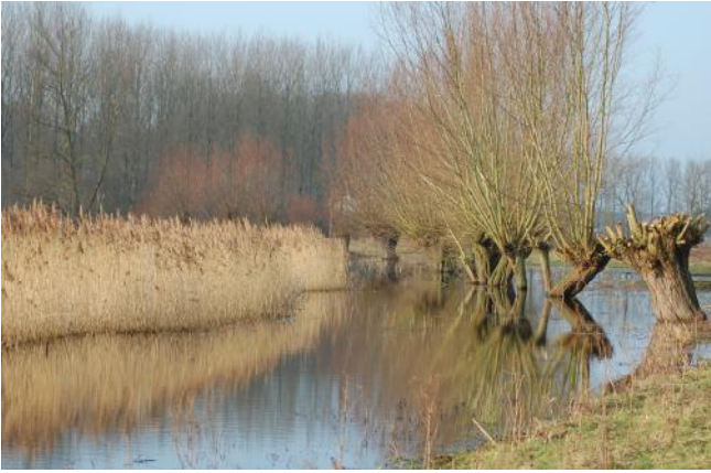
Turfmeersen in de winter